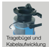
Tragebügel und Kabelaufwicklung