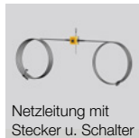
Netzleitung mit Stecker u. Schalter