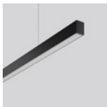
LESS IS MORE 27